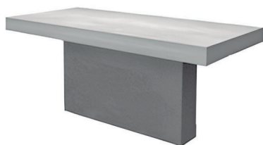
Mesa París 150 HBAU50