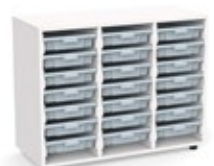
YCW-21216X_ROJO YCW-21216X_VERDE YCW-21216X_GRIS